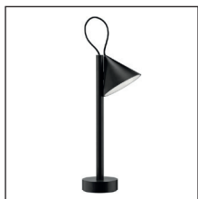
COD. ME01 B