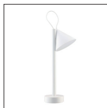
COD. ME01 W