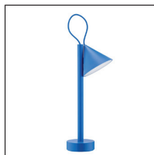
COD. ME01 DAZ