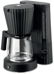
MDL14 B - Plissé Design Michele De Lucchi, 2023 Macchina per caffè filtrato in resina termoplastica, nero. cl 150 - cm 28x22,5 - h cm 35