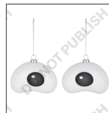
COD. PLA01SET2 NICK CM 9,5 X 12 H CM 8,5