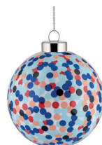
COD. AM43 3 - Proust Design Alessandro Mendini, 2023

Palla per albero di Natale in vetro soffiato. Decorata a mano.