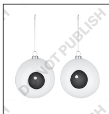
COD. PLA01SET1 CAROL CM 10 X 10 H CM 10,5