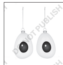
COD. PLA01SET3 HOLLY CM 8,5 X 9,5 H CM 12