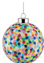
COD. AM43 1 - Proust Design Alessandro Mendini, 2023

Palla per albero di Natale in vetro soffiato. Decorata a mano.