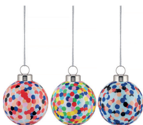
COD. AM43SET3 - Proust Design Alessandro Mendini, 2023

Set di 3 palle per albero di Natale in vetro soffiato. Decorate a mano.