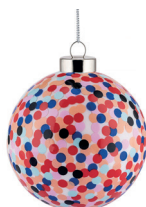
COD. AM43 2 - Proust Design Alessandro Mendini, 2023

Palla per albero di Natale in vetro soffiato. Decorata a mano.